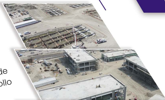
Etapas de desarrollo